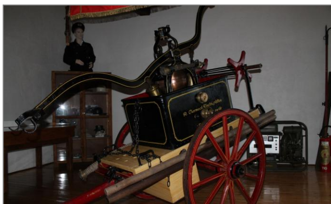
Historická březovská stříkačka z 19 století na hradě Vildštejn.