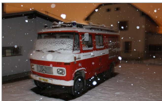
Hasičský automobil skalenských hasičů Mercedes o vánocích 2014 - před renovací.