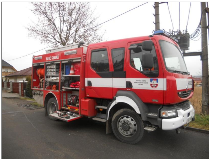
CAS 24 Renault Midlum - JSDH Skalná

CAS 24 Renault Midlum je u jednotky dobrovolných hasičů Skalná zařazen od roku 2007. Během této doby byl nasazen u 335 mimořádných událostí. Celkem zasahovali skalenští hasiči s tímto vozidlem u 149 požárů, v 54 případech zasahovali u dopravních nehod. 99 krát vyjžděli k technickým zásahům, kam patří čerpání vody ze zatopených sklepů, odstraňování následků větrných smrští zejména popadaných stromů z pozemních komunikací nebo budov a také likvidace vosích a sršních hnízd. V 11 případech bylo toto vozidlo u zásahu na likvidaci nebezpečné látky. Ve 12 událostech hasiči spolupracovali s policií ČR při vyhledávání ztracených osob nebo byli povoláni na pomoc posádce rychlé zdravotní služby se snesením pacienta. Ve třech případech posádka tohoto vozidla zachraňovala osoby nebo zvířata z vody a v 7 případech vyjeli k planému poplachu. Nejčastěji toto vozidlo mohli vidět občané na území města Františkovy Lázně a to v 121 případech. 108 krát tato cisterna zasahovala na skalensku. V Třebení 14x, v Plesné 13x, v Lubech a Křižovatce po 11 zásazích, 10x ve Vojtanově, 9x ve Velkém Luhu, 8x v Libé a Házlově, 7x