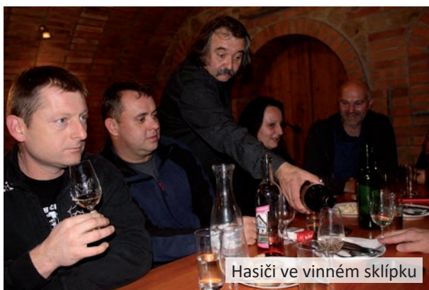
Hasiči ve vinném sklípku