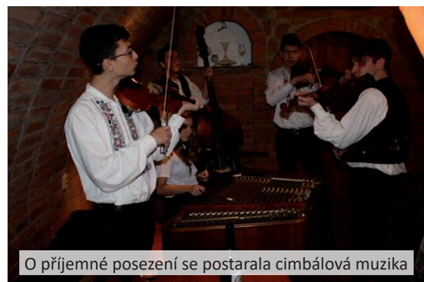
O příjemné posezení se postarala cimbálová muzika