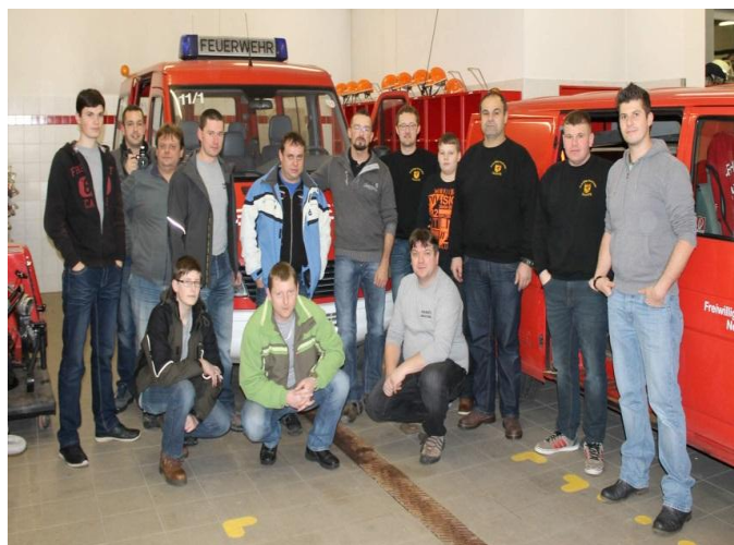
Hasiči ze Skalně na návštěvě FFW v Neusorgu