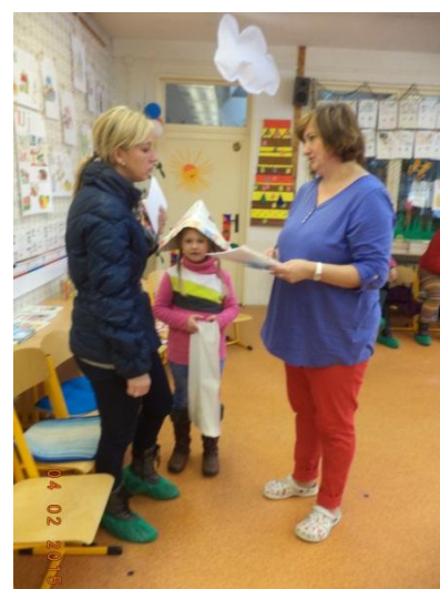
To je pastelek, můžu si vybrat! Za svůj výkon dostanu odměnu! Hurá! Vzali mě do školy!