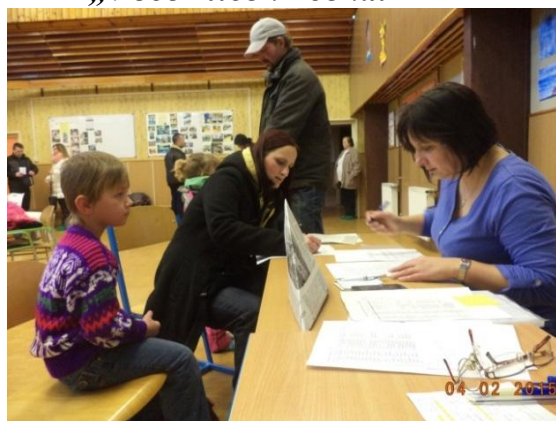
Zápis potvrzený rodiči.