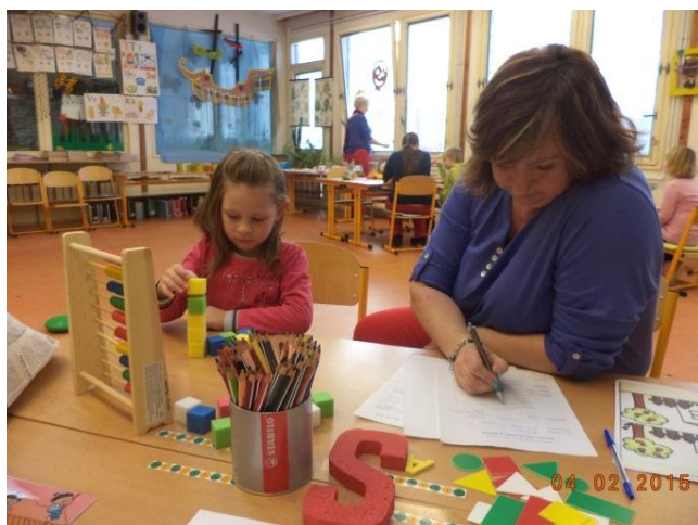
Stavím, počítám, orientuji se.