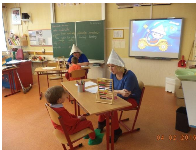
A už si povídáme s „Večerníčky“.