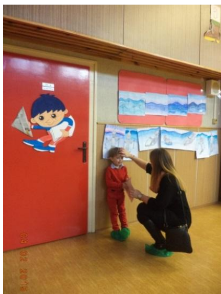
Nervozita před pohovorem?