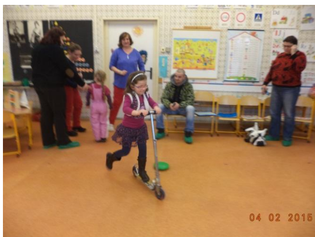
Projedu se na koloběžce.