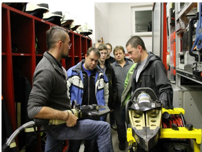
Skalenští hasiči si prohlédli techniku neusorských hasičů.