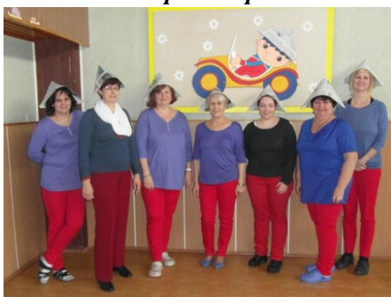
Učitelky v plné zbroji.