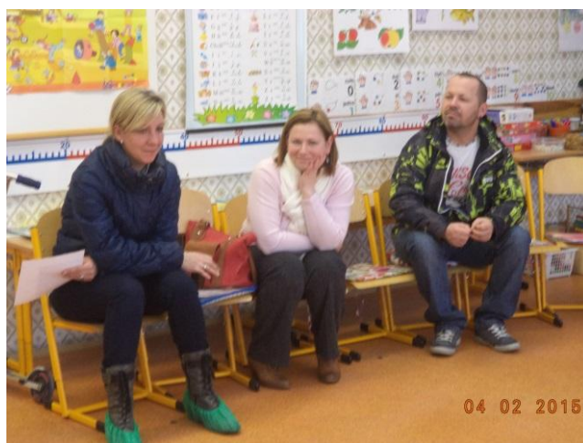
Rodiče mě pozorují.