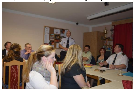
Náměstek krajského ředitele HZS ing. plk. Oldřich Volf děkuje skalenským hasičům za příkladnou práci při záchraně zdraví a majetku na skalensku a františkolázeňsku.