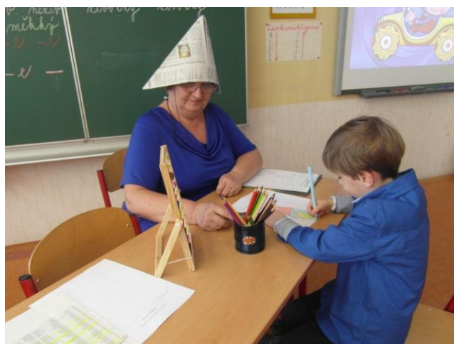
Ještě namaluji maminku.