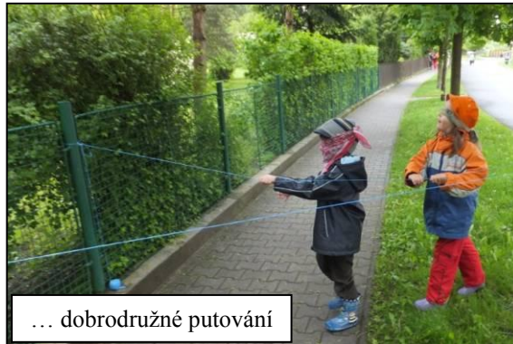
... dobrodružné putování