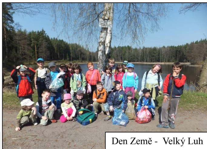
Den Země - Velký Luh