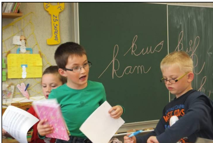
... když se z dětí stanou učitelé aneb „Den naruby“

Celý rok jsme si náramně užívali spoustu legrace a různá překvapení. A nyní nás již čeká pouze „Pasování na čtenáře“, školní výlet do ZOO a Dinoparku v Plzni... A potom už jen do dále, jako správní námořníci zvoláme: „Na shledanou, školo!“ „Ahoj, prázdniny!“