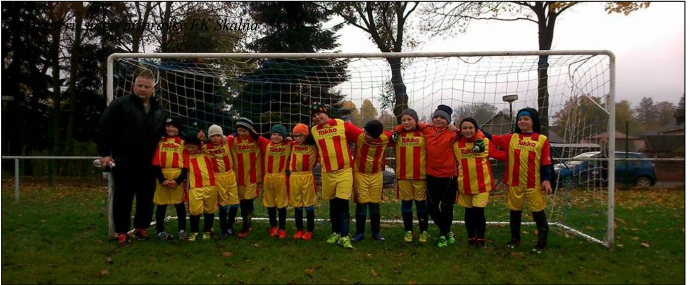
Tým trenérů starší přípravy FK Skalná

STP příprava FK Skalná odehrála svůj poslední zápas podzimní části sezony 2016/2017. Jsme velice rádi, že jsme celou podzimní část sezony podávali velice vyrovnané a výborné výkony, v každém utkání zazářil jiný hráč, což jako trenéři velice kvitujeme. Velice děkujeme všem hráčům za předvedené výkony ve všech zápasech a v přístupu na tréninku, děkujeme všem rodičům a přátelům dětí za neustálou podporu při utkáních a těšíme se společně na další skvělé výkony v jarní části sezony starší přípravy.