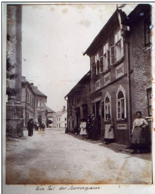
Pohled z náměstí