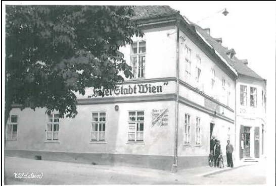
Hotel Město Vídeň

Ví se, že ulice ve starých dobách nesla název „ Leipziger Weg “ ( Lipská cesta ), protože tudy od středověku vedla dálková trasa z Řezna (Regensburg) přes Cheb do Lipska. Kdy ulice dostala jméno Herrengasse , není známo. Bylo to pravděpodobně proto, že spojovala všechna tři panská sídla ve Skalné a panstvo se tudy ubíralo v neděli na mši. Za války se ulice jmenovala tendenčně Konrad-Henlein-Strasse , potom dlouho byly ulice bez názvů, nyní je to od roku 1999 Česká ulice .