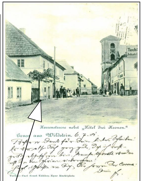
Hotel Tři koruny