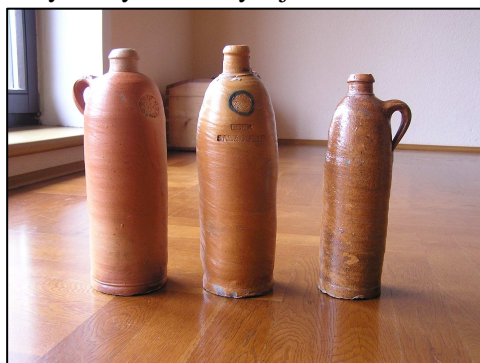
Nádoby na minerální vodu kolem roku 1800

Podle zmíněné soudní zprávy voda přinesla skoro 4 tuny velkých balvanů a vytrhla celé lesní stromy i s kořeny. Jednou z příčin této katastrofy, nespíš hlavní příčinou, byla zjištěna nekvalitní práce při opravě hráze rybníka na podzim předcházejícího roku. Svědkové vypovídali, že už mrzlo a byly použity například i zmrzlé drny, které na jaře nevydržely tlak vody z jarního tání.