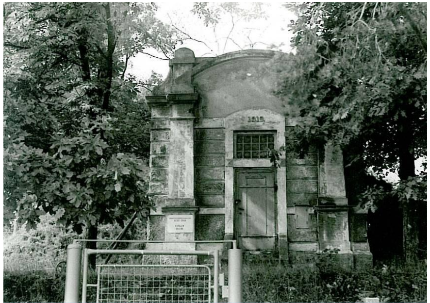
Stará vodárna ve Skalné

V letech 1991 – 93 byl vybudován nový přivaděč z Antonínovy Výšiny do Skalné a dále do Plesné a Lubů. V roce 1993 byla uvedena do provozu čistírna odpadních vod ve Skalné.